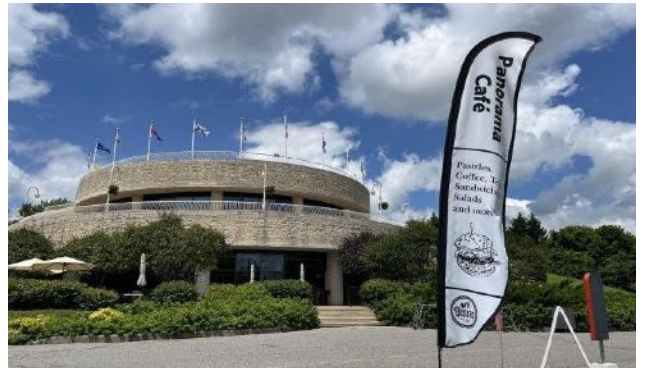
Splendid view on the terrace of the Panorama Café at the Museum of History of Gatineau, as well as the group who took the opportunity to eat and drink.