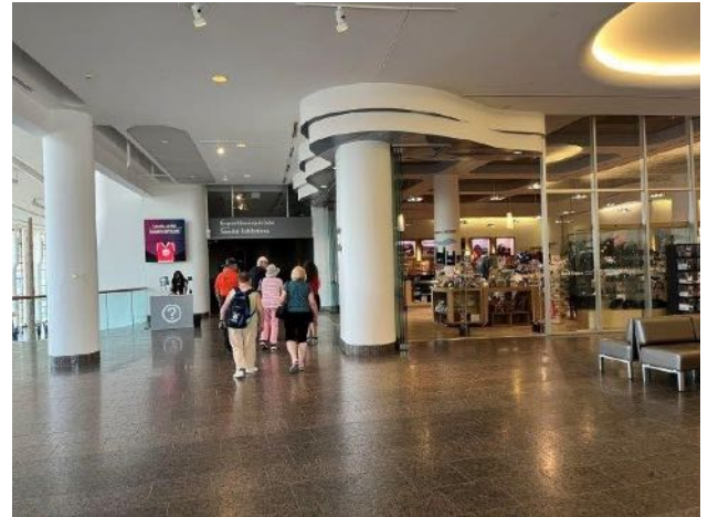
Visite du Musée de l'Histoire—Visit of the Museum of History