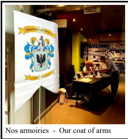
Nos armoiries - Our coat of arms