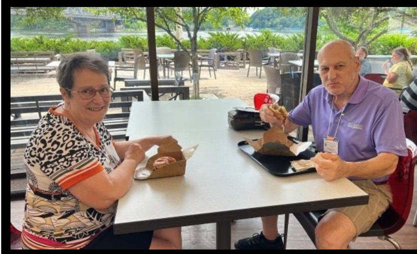
A short break to fill our belly and give ourself the strength to continue the visit. On the thumbnail, our photographer Elizabeth