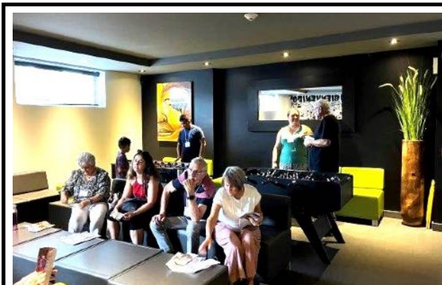
Inscription terminée, en attente du départ pour le Musée. Registration completed, awaiting departure for the Museum.