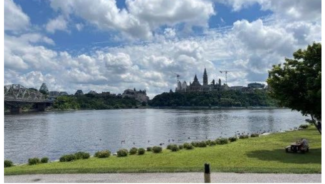
Vue Splendide sur la terrasse du Panorama Café au Musée de l'Histoire de Gatineau, ainsi que le groupe qui en a profité pour manger et se désaltérer.