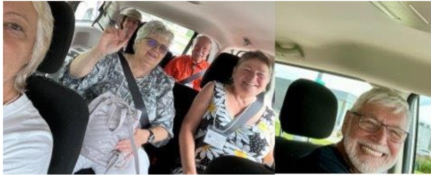
En route pour le Musée de l'Histoire.- On the way to the Museum of History